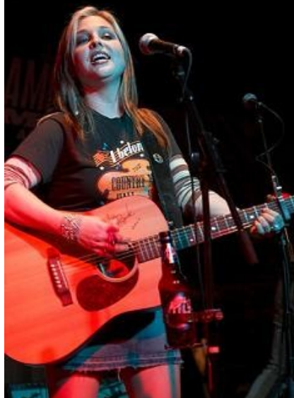
Sunny Sweeney – jej pierwszy singel From A Table Away trafił na listę przebojów country