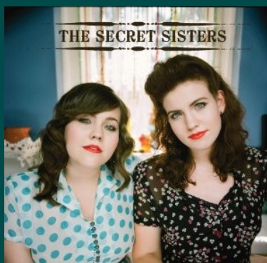
The Secret Sisters - The Secret Sisters